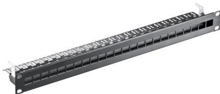
Rys. 3. Panel krosowy 24 porty

Do szafy GPD należy doprowadzić również okablowanie od przyłącza telefonicznego i zarobić na panelu telefonicznym kat. 3.