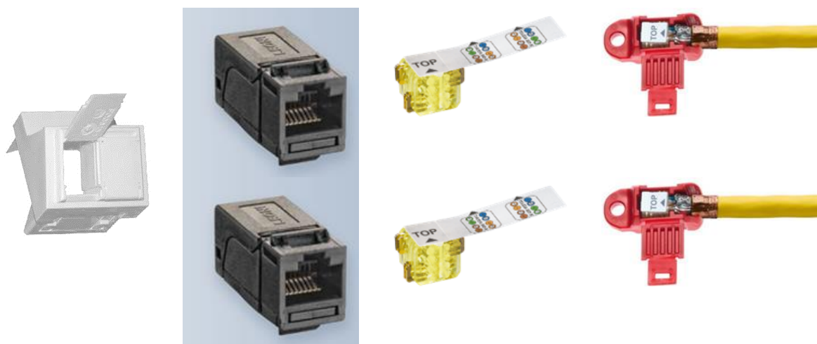
Rys.1. Wkład Punktu Logicznego

Układ Punktu Logicznego pokazano na poniższym rysunku poglądowym. W zależności od konfiguracji punktu należy doprowadzić jeden lub dwa kable transmisyjne. W przypadku PEL-a składającego się z jednego modułu, należy użyć ramki jednokrotnej.